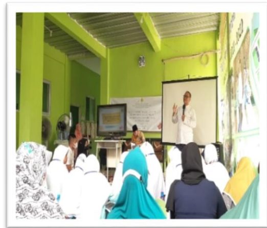
Gambar 2. Penjelasan mengenai penerjemahan.

dari kalimat tersebut[9]. Dalam pelatihan ini difokuskan terlebih dahulu penerjemahan secara harfiyah dengan mengartikan kata perkata agar memudahkan jamaah dalam memahami dan proses menerjemahkan.