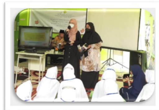
Gambar 5. Penjelasan materi dan proses penerjemahan.

Kegiatan selanjutnya adanya kegiatan diskusi dan tanya jawab dimana ibu-ibu jama'ah Rasyidaturrahmah sangat antusias mengenai pengetahuan baru perihal penerjemahan ini. Hasil dari kegiatan tersebut menunjukkan bahwa