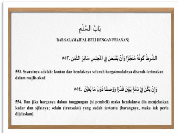
Gambar 4. Bab Wakalah bil Ujrah

Setelah pengantar sekaligus penjelasan mengenai penerjemahan, dilanjutkan dengan proses penerjemahan kitab Matn Zubad yakni bab salam oleh mahasiswi prodi Pendidikan Bahasa Arab. Karena kitab Matn Zubad ini bentuknya nadzom atau perbait hal ini memudahkan dalam proses penjelasannya. Diawali dari bait pertama bab Salam .