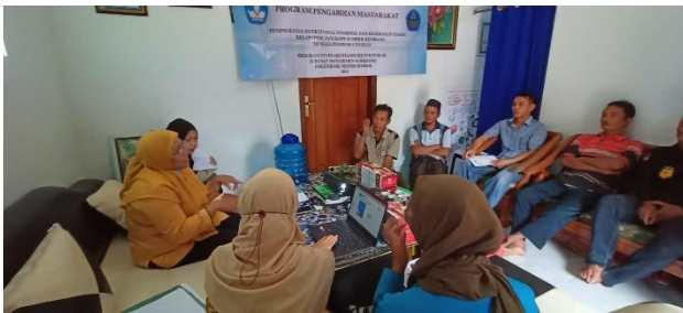
Gambar 5. Pelatihan Mencuci Tangan di Kelompok Tani Sumber Kembang

Tahapan selanjutnya setelah memberikan fasilitas tempat cuci tangan dan tempat sampah pintar adalah dengan memberikan pelatihan tentang cara mencuci tangan dengan baik dan benar menggunakan sabun dan air mengalir. Hal ini bertujuan agar tangan benar-benar bersih dari kuman dan bakteri sehingga dapat meningkatkan kualitas kesehatan petani di Kelompok Tani Sumber Kembang [8]. Berikut merupakan kegiatan pelatihan cara mencuci tangan yang baik dan benar: