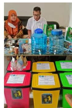
Gambar 4. Serah Terima tempat cuci tangan dan Tempat Sampah

Solusi terakhir yang diberikan pada pengabdian ini adalah peningkatan kesehatan usaha. Salah satu hal yang dapat menjaga kebersihan adalah mencuci tangan dengan sabun. Hal ini akan berdampak pada kebersihan dan kesehatan lingkungan usaha [6]. Selain itu, peningkatan kesehatan usaha adalah dengan menyediakan fasilitas kebersihan yakni tempat sampah pintar [7]. Hal ini diharapkan dapat meningkatkan kesadaran kelompok Tani Sumber Kembang akan kesehatan di tempat usaha.