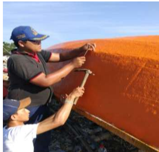
Gambar 5. Pemakuan lapisan fiberglass pada lambung kapal

Penguatan dengan paku ukuran 1 cm dilakukan setiap jarak 20-30 cm. Tujuan dari pemakuan ini adalah untuk memperkuat lapisan fiberglass pada lambung kapal sehingga tidak ada kemungkinan lapisan fiberglass terlepas dari lambung kapal kayu.