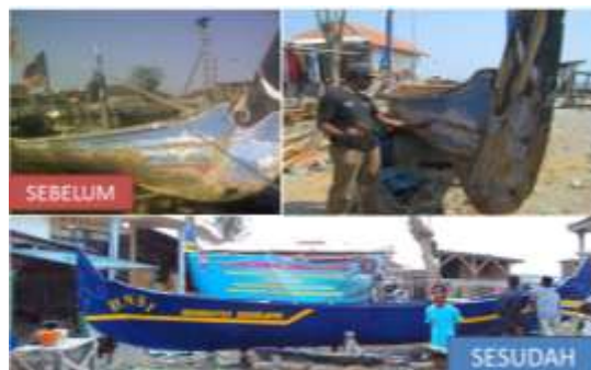
Gambar 11. Pekerjaan laminasi fiberglass di Pasuruan

Keuntungan dari aspek ekonomi laminasi fiberglass untuk perbaikan kapal dibandingkan dengan perbaikan kapal secara tradisional dapat dirinci sebagai berikut: