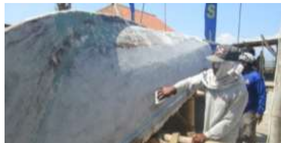
Gambar 7. Penghalusan