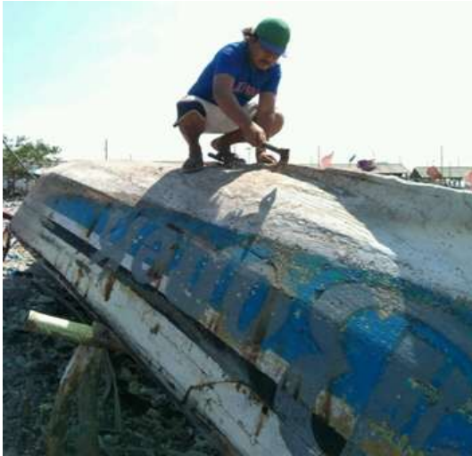
Gambar 3. Pembersihan lambung kapal

Pembersihan lambung kapal bertujuan untuk menghilangkan sisa cat dan dempul yang masih menempel di lambung kapal, sehingga laminasi fiberglass pada tahap berikutnya bisa merekat dengan erat dan sempurna