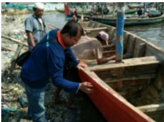
Gambar 8. Pengecatan

Lapisan terakhir adalah cat khusus dengan campuran pigmen warna dan resin yang dicampur dengan adiktif untuk membuat permukaan kapal jadi lebih mengkilap dan tidak mudah kotor. selain itu dengan cat khusus campuran ini akan menghindari menempelnya binatang laut, kerak pada lambung kapal, hanya lumut yang mampu menempel dan cukup dibersihkan dengan cara yang mudah.