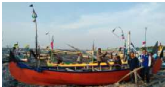
Gambar 9. Finishing

Beberapa hasil pekerjaan laminasi fiberglass yang lain adalah sebagai berikut: