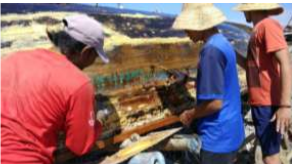
Gambar 4. Pelapisan serat fiberglass pada lambung kapal

Laminasi fiberglass sebanyak 2 lapis (resin-mat-resin-mat-resin ) akan menambah ketebalan kapal sebesar 3mm.