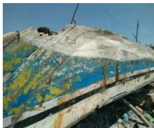
Gambar 2. Pengeringan kapal kayu

Tujuan dari pengeringan ini adalah untuk menghindari kandungan air dalam kayu yang akan merusak lapisan fiberglass yang akan merekat erat pada lambung kapal. resin, serat fiberglass dan kayu tidak akan bisa merekat erat jika terkena air meski dalam jumlah yang sangat sedikit.