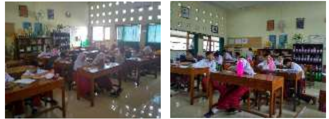
Gambar 2. Pelaksanaan pengabdian kepada masyarakat

Pertemuan kedua, ketiga, dan keempat adalah penyampaian materi dan pembahasannya. Materi terbagi menjadi menjadi soal isian singkat (berbahasa Inggris dan Indonesia) dan uraian eksplorasi dan pengembangan. Materi tersebut diambil dari kelas 4, 5, dan 6. Metode pada penyampaian materi dilakukan dengan metode ceramah, pengabdian menjelaskan konsep-konsep dasar matematika, karakteristik soal, dan memberikan gambaran umum mengenai soal-soal olimpiade. Selanjutnya, pemberian soal latihan sesuai dengan materi yang disampaikan pada tiap pertemuannya. Latihan soal menggunakan metode diskusi karena sifatnya memecahkan masalah, dengan diskusi harapannya ada tambahan ide dari siswa lain dalam menyelesaikan soal tersebut serta menambah pemahaman siswa. Pada akhirnya, perwakilan siswa menyampaikan hasil diskusi bersama temannya dan memungkinkan sesi tanya jawab antar siswa. Temuan unik pada sesi ini adalah saat siswa menyampaikan hasil diskusinya ternyata ditemukan banyak cara penyelesaian untuk satu soal yang sama dan semua jawabannya benar, sehingga siswa mendapat tambahan alternatif dalam menyelesaikan soal. Berikut adalah beberapa foto dalam pelaksanaan kegiatan pengabdian kepada masyarakat.