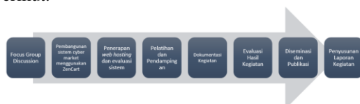
Gambar 3.1 Metode Pelaksanaan Kegiatan

Metode pelaksanaan kegiatan meliputi beberapa tahap, seperti terlihat pada Gambar 3.1 sebagai berikut.