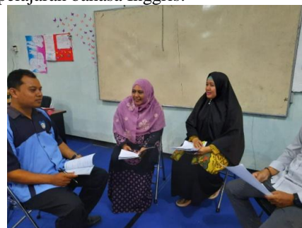
Gambar 3. Pelatihan untuk Guru SMK TRUNOJOYO

Hasil sosialisasi tersebut guru bahasa Inggris akan mengetahui dan memahami soal-soal yang berkualitas HOTS atau tidak. Dengan demikian para guru dapat membuat soal-soal tersebut untuk pengayaan materi latihan persiapan UNBK untuk mata pelajaran bahasa Inggris.