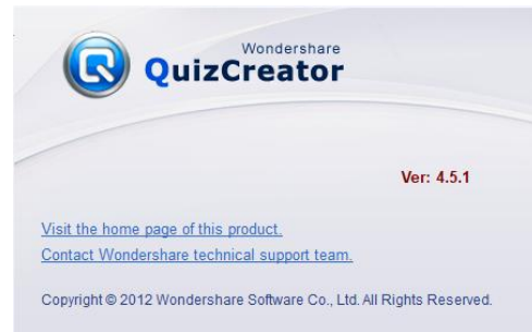
Gambar 3. QuizCreator Wondershare

berulang-ulang baik disekolah atau dirumah masing-masing.