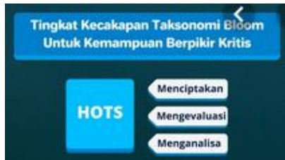
Gambar 2. Gambaran HOTS

dalam mengerjakan soal Bahasa Inggris UNBK. Selain itu flashdisk interkatif ini diisi dengan kompilasi soal-soal tahun lalu dan diperkaya materi tambahan dengan kualitas HOTS sehingga para siswa calon peserta UNBK berikutnya dapat mengerjakan dan menjawab soal lebih banyak benarnya. Pada akhirnya nilai rata-rata Bahasa Inggris UNBK dapat meningkat.