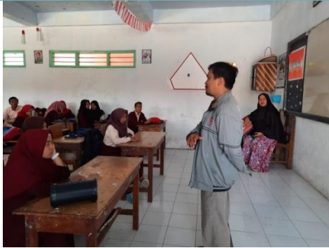
Gambar 4. Pelatihan untuk Siswa