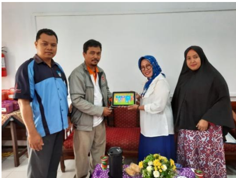
Gambar 5. Bantuan alat peraga