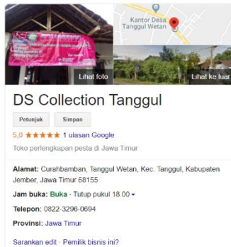
Gambar 4. Pendampingan Pembuatan Sosial Media