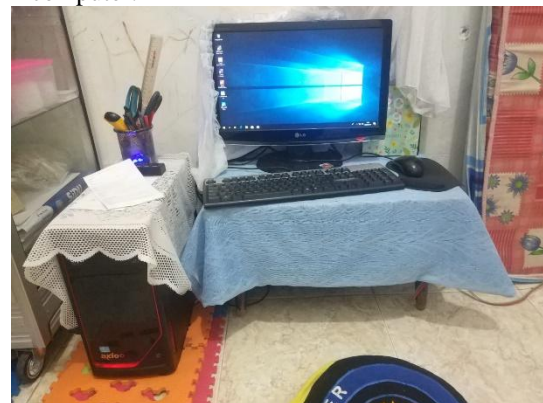
Gambar 2. Perangkat Komputer