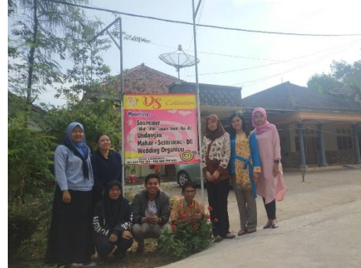
Gambar 7. Monitoring Akhir