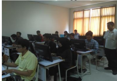
Gambar 3. Pelatihan pemanfaatan e-commerce berbasis android

mendukung proses bisnis yang ada di UKM penjualan baju dalam hal ini Hamzah Collection. Pelatihan diikuti oleh karyawan Hamzah Collection dan bertempat di Jurusan Teknologi Informasi. Luaran dari kegiatan pelatihan ini karyawan Hamzah Collection mampu menggunakan dan memanfaatkan secara maksimal aplikasi e-commerce yang sudah dibuat pada tahapan sebelumnya. Pada tahapan ini juga e-commerce Android diintegrasikan dengan digital branding melalui media sosial facebook, instagram, twitter dan whats app.