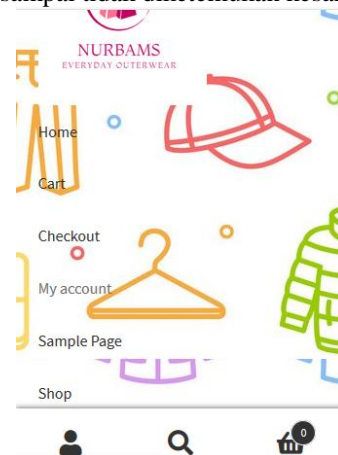
Gambar 2. Tampilan Aplikasi Android

pengembangan aplikasi e-commerce berbasis android dimulai dengan pembuatan desain sistem berdasarkan hasil survey kebutuhan pengguna pada tahapan sebelumnya. Aplikasi yang dibuat berbasis android dengan memanfaatkan web service pada sisi server. Selanjutnya aplikasi diuji coba dalam lingkungan internal untuk mengetahui kesalahan sistem yang ada. Uji coba internal dilakukan secara berulang sampai tidak ditemukan kesalahan lagi.