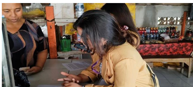
Gambar 3 Mengajarkan Cara Pembuatan Pembukuan sederhana

Pemberian materi sesuai gambar 2 ditunjukkan untuk memberi tahu akan pentingnya pembukuan sederhana bagi usahanya serta dapat menambah pengetahuan para UMKM mengenai Pembukuan Sederhana