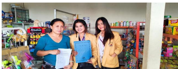
Gambar 2 Pemberian Materi Terkait Pembukuan Sederhana

Pemberian materi sesuai gambar 2 ditunjukkan untuk memberi tahu akan pentingnya pembukuan sederhana bagi usahanya serta dapat menambah pengetahuan para UMKM mengenai Pembukuan Sederhana