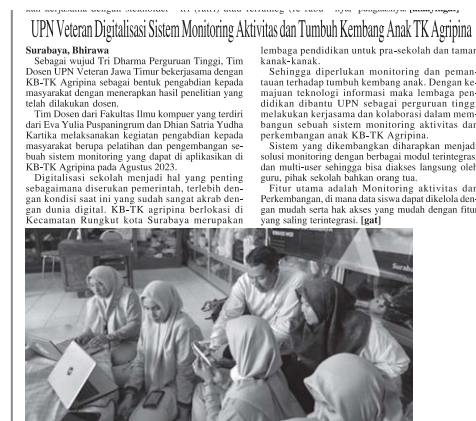
Gambar 9. Media Massa

Redaksi berita yang terbit dapat dilihat pada Gambar 9.