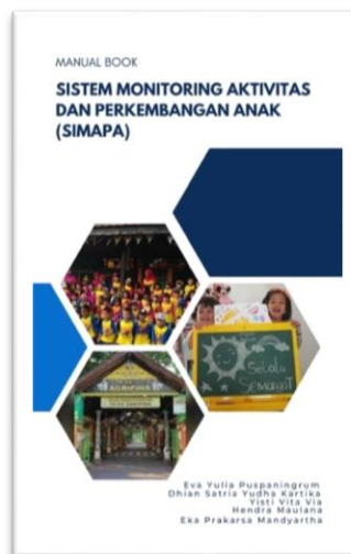
Gambar 7. Modul Pelatihan dan User Manual Sistem

Sebagai Tindak lanjut dari kegiatan pengabdian masyarakat ini, apabila peserta mendapat kesulitan dalam penggunaan sistem maka tim sudah memberikan user manual atau modul dalam penggunaan sistem SIMAPA. Modul ditunjukkan Gambar 7.