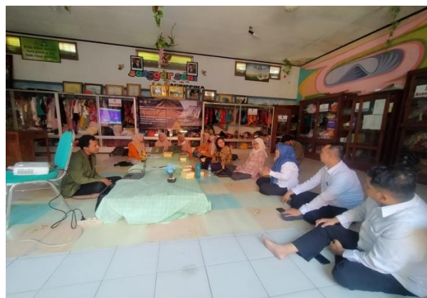
Gambar 6. Diskusi