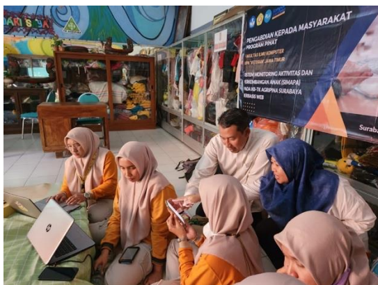
Gambar 5. Tim memberikan arahan