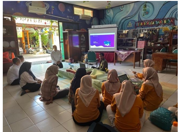
Gambar 2. Pembukaan Acara

Kegiatan diawali dengan pembukaan kegiatan pengabdian kepada masyarakat oleh ketua Tim dan dilanjutkan pembukaan oleh Kepala Sekolah KB-TK Agripina seperti terlihat pada Gambar 2.