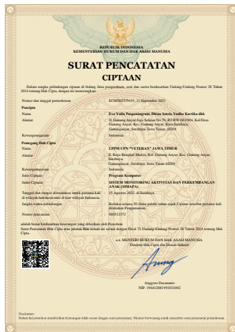
Gambar 8. HKI sistem SIMAPA

Untuk memberikan informasi kepada masyarakat bahwa telah terselenggaranya Kegiatan pengabdian masyarakat ini, maka tim pelaksana menerbitkan dalam bentuk berita di media massa harian Bhirawa Surabaya baik cetak maupun online. Media Online yang dapat diakses di link berikut: