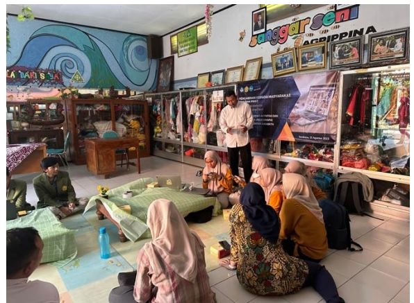
Gambar 3. Tanya Jawab

Setelah itu dilanjutkan dengan kegiatan Ceramah materi tentang perkembangan teknologi guna mendukung kegiatan pembelajaran. Setelah itu dilakukan tanya jawab dengan peserta yang ditunjukkan oleh Gambar 3.