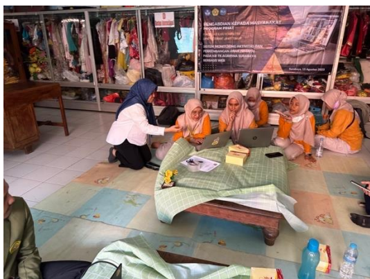
Gambar 4. Tim memberikan arahan 1

pelatihan kepada peserta tentang penggunaan sistem SIMAPA. Pada sesi ini peserta akan mencoba semua fitur pada sistem yang nantinya akan diimplementasikan di KB-TK Agripina Surabaya. Gambar 4 dan 5 menunjukkan Tim sedang memberikan arahan kepada guru dalam penggunaan sistem SIMAPA. Terlihat peserta sangat antusias dan bersemangat dalam mempelajari fitur-fitur yang ada pada sistem. Saat pelatihan berlangsung peserta diberikan login ke sistem untuk menguji sistem secara langsung.