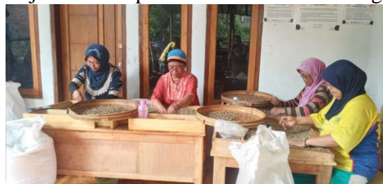
Gambar 1. Aktivitas Kelompok Tani Sumber Kembang

Berikut merupakan tampilan aktivitas pekerja di Kelompok Tani Sumber Kembang: