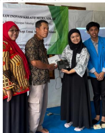
Gambar 8. Serah Terima Alat

Tahapan akhir adalah serah terima alat seperti disajikan pada Gambar 8.