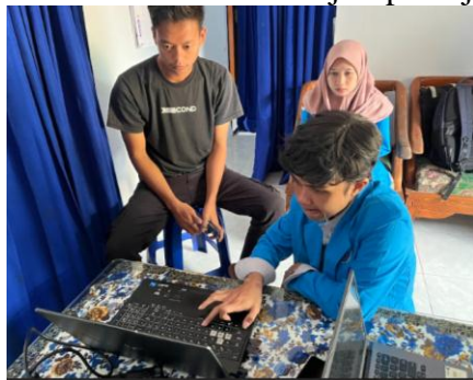
Gambar 6. Identifikasi Sidik Jari Pekerja

Pada kegiatan pelatihan tersebut, tim melaksanakan identifikasi sidik jari kepada seluruh pekerja. Berikut merupakan dokumentasi identifikasi sidik jari pekerja: