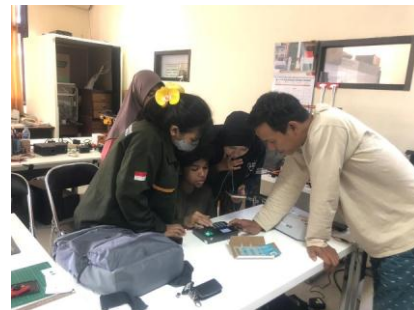
Gambar 4. Perancangan Aplikasi Presensi

Selanjutnya adalah proses perancangan sistem informasi manajemen berupa presensi yang dilakukan oleh Ibu Dia Bitari Mei Yuana dan Bapak Nur Faizin. Berikut merupakan dokumentasi kegiatan perancangan aplikasi presensi: