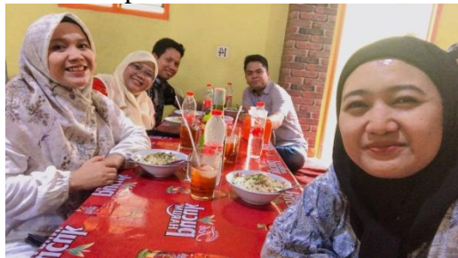
Gambar 2. Rapat Koordinasi

Kegiatan pengabdian ini diawali oleh rapat dengan seluruh tim pelaksana guna menyamakan persepsi terkait kegiatan pengabdian ini. Pada kegiatan diperoleh hasil pembagian tugas untuk penyelesaian permasalahan mitra seperti yang disajikan pada Tabel 1. Berikut merupakan dokumentasi pelaksanaan rapat koordinasi: