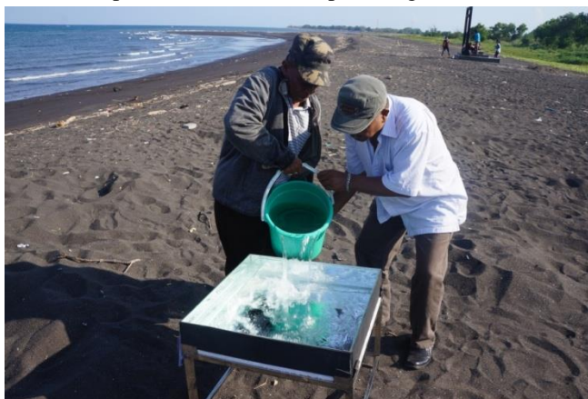
Gambar 3. Implementasi Alat Desalinasi Air Laut

Pada saat kunjungan ke lokasi mitra, tim pengabdian masyarakat bertemu dengan Lurah Kepatihan yang mengapresiasi akan adanya alat distilasi air laut ini. Alat distilasi air laut ini dipandang sebagai salah satu solusi bagi para nelayan untuk mengatasi kesulitan akan air bersih di wilayah pesisir pantai. Beliau juga berpesan agar diadakan kerjasama secara kontinyu untuk pengembangan teknologi di perguruan tinggi yang dapat diimplementasikan pada masyarakat. Dari pihak nelayan juga menyambut baik akan adanya bantuan alat distilasi ini dan berharap agar alat tersebut dapat dimanfaatkan secepat mungkin.