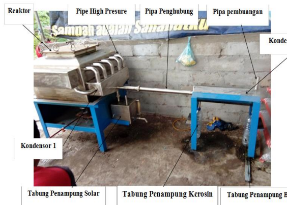
Gambar 2. Instalasi reaktor pyrolisis

Berikut adalah gambar reaktor pyrolisis plastik.