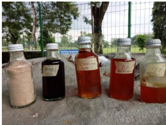
Gambar 3. Bahan Bakar Plastik Polypropilene

Dari hasil penyulingan sampah plastik yang didapat diperlukan serbuk penjernih, dimana untuk 1 liter diperlukan serbuk penjernih sebanyak 1 sendok makan yang dicampurkan kedalam botol bahan bakar lalu dikocok terlebih dahulu setelah itu didiamkan kurang lebih selama 1 jam. Setelah 1 jam baru dilakukan penyaringan pada masing-masing bahan bakar, setelah selesai bahan bakar sampah dari plastik baru bisa digunakan.