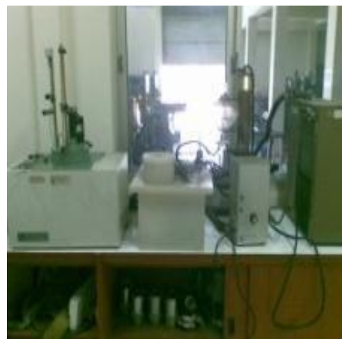
Gambar 1. Alat Bom Calorimeter

Nilai kalor dari variasi spesimen bahan bakar akan diuji menggunakan bomb calorimeter khusus bahan bakar cair. Bomb calorimeter yang dipakai adalah milik laboratorium uji motor bakar universitas brawijaya malang. Standar kalibrasi mengikuti ketentuan dari laboratorium yang dimaksud.