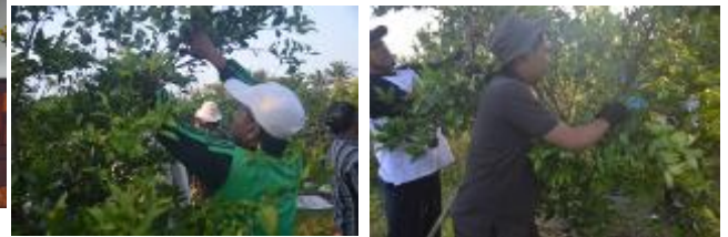
Gambar 5. Praktek manajemen kanopi dan manajemen merangsang pembungaaan (teknis pikung) di lahan Demplot