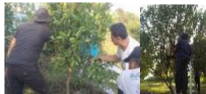
Gambar 6. Pengendalian hama dan penyakit