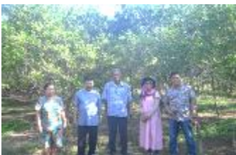
Gambar 1. Kegiatan analisa lokasi kebun jeruk yang akan dijadikan demplot, dan prakiraan kebutuhan alat/bahan