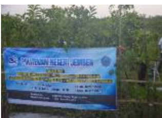
Gambar 3. Lahan Mitra yang dijadikan Demplot