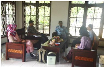
Gambar 2. Tim BOPTN berkoordinasi dengan Mitra