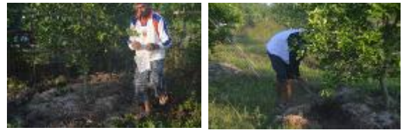
Gambar 4. Praktek manajemen nutrisi (pemupukan anorganik dan organik di lahan Demplot)