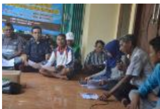
Gambar 2. Kegiatan Tim BOPTN melakukan kegiatan Penyuluhan