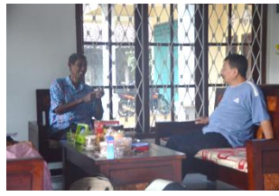
Gambar 3. Ketua Tim BOPTN berkoordinasi dengan ketua kelompok Mitra