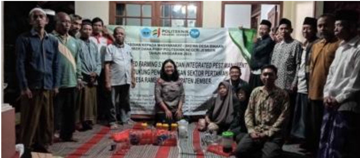
Gambar 1. Kelompok Tani Karya Bhakti

Metode partisipatif dipilih karena dinilai paling efektif untuk membangun rasa memiliki terhadap program serta memastikan keberlanjutan kegiatan setelah masa pendampingan berakhir [13]. Pendekatan ini dilakukan pada beberapa tahapan, yaitu survey dan sarasehan awal, sosialisasi program dan penyuluhan serta monitoring dan evaluasi.