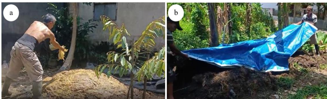
Gambar 3. Praktik Pengomposan. Penyiraman Larutan Dekomposer (a) dan Hasil Akhir Pengomposan (b)

Tim juga memberikan penyuluhan mengenai pemanfaatan air limbah tempe sebagai media perbanyakan dekomposer, mencakup pemilihan bahan, teknik fermentasi, dan penggunaan hasilnya dalam pengomposan. Selain itu, peserta memperoleh pelatihan pembuatan kompos dari kotoran ternak (Gambar 3). Kegiatan pelatihan dilakukan secara langsung di lapangan agar peserta mendapatkan keterampilan praktis yang dapat diterapkan secara mandiri. Kehadiran Ketua Kelompok Tani Karya Bhakti, Bapak Moh. Suep Sugianto, memberikan dukungan moral besar dan beliau menyampaikan harapan agar kerja sama dengan Politeknik Negeri Jember dapat terus berlanjut di masa mendatang.